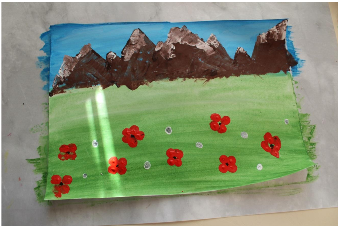
11. Рисуем маки кончиком кисти на дальнем плане поля.