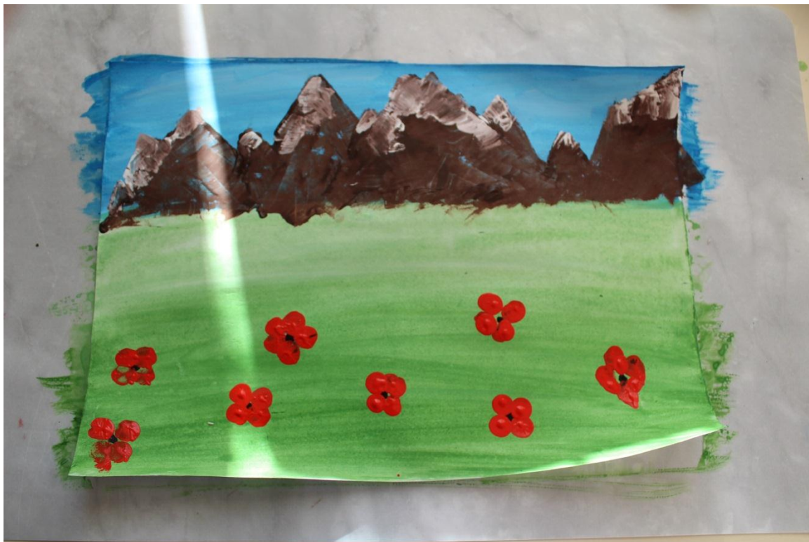
9. Также пальчиком рисуем одуванчики.