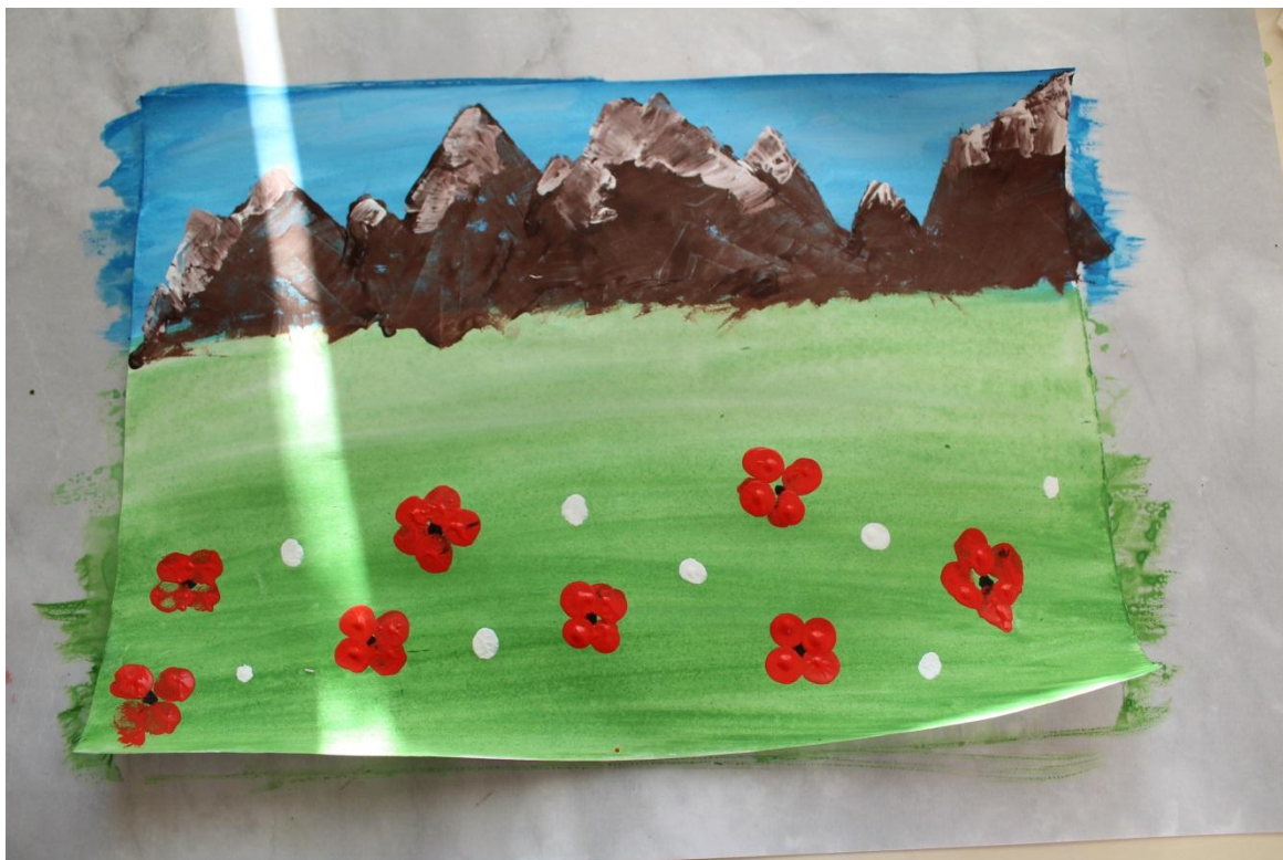
10. В серединку одуванчика капаем черную гуашь и зубочисткой придаем объем.